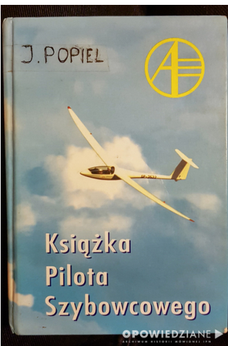
Okładka „Książki Pilota Szybowcowego” Jacka Popiela