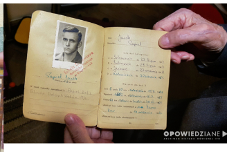
Pierwsza strona „Książki Pilota Szybowcowego” Jacka Popiela